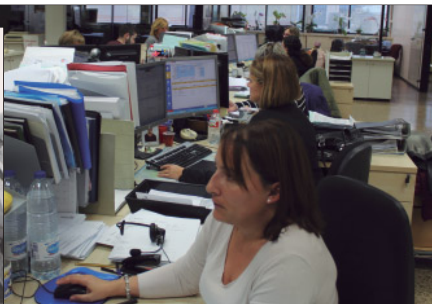
El papel de la mujer predomina en las empresas transitarías (oficina de Nadal Forwarding)

El papel de la mujer en el ámbito transitario y logístico es notorio, aunque seguramente escaso de visibilidad, cada vez menos es cierto, como sucede en otros entornos laborales. Las profesionales se abren paso en el sector dentro de un proceso de selección natural de talento y de formación, no escaso de trabas, por lo que nos debe hacer valorar aún más si cabe esta evolución.