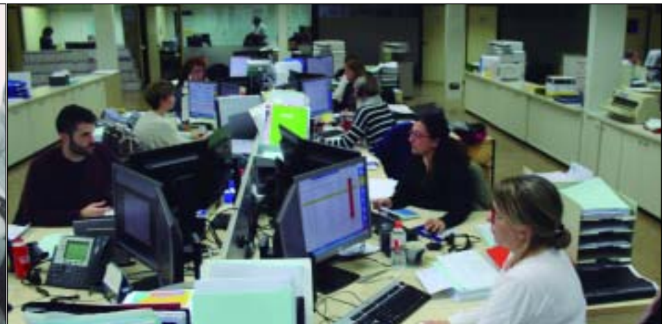
El papel de la mujer predomina en las empresas transitarias (oficina de Nadal Forwarding)